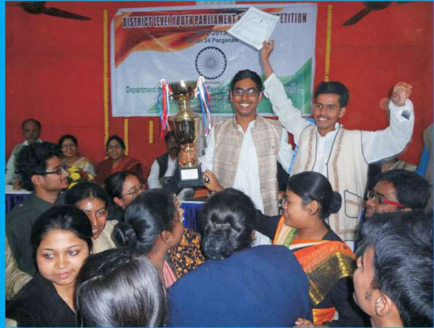
Moment of victory : Trophy reclaimed by Vivekananda college Thakurpukur